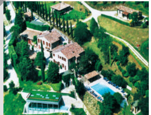
Panoramica del complesso con le piscine ed il Centro Convegni

Il nuovo modello comprende la grande Piscina Estiva con Bar e Ristorante immersi nel verde; la Piscina Termale coperta di modello "a sfioro" da cui l'impressione di essere "nell'acqua e nel verde"; il Centro Convegni per oltre 90 posti.