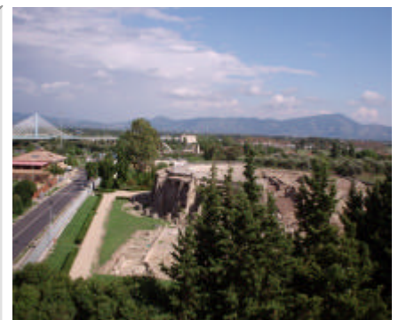
Vista dell'Anfiteatro dalla Terrazza

Il "Postiglione" offre una ristorazione di marca laziale e campana di grande effetto in un'atmosfera di classe, nei saloni interni, mentre nella stagione estiva viene utilizzato il vasto giardino prospiciente l'Anfiteatro.