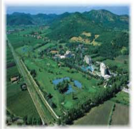
Veduta panoramica del Parco, Golf e delle strutture alberghiere con le Terme

Sulla scia dell'incremento costante delle presenze italiane, il Management delle Terme di Galzignano intende andare incontro alla domanda con l'istituzione di un Centro Congressi in grado di prolungare la stagione turistica.