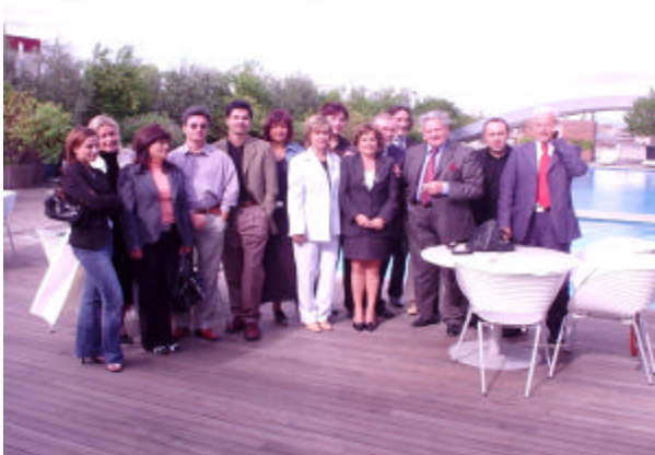
Nel riquadro la “classica” foto di Gruppo dei partecipanti nella suggestiva cornice della piscina ES Hotel

Nella splendida cornice dell' ES Hotel di Roma si è svolto il III° Meeting del Gruppo di Lavoro della A. & M. International . Il tema dominante delle conversazioni è stato incentrato sui diversi aspetti metodologici e di coordinamento nelle attività oltre a fare il punto sulla creazione della Banca Dati Turismo e sulle opportunità Immobiliari.